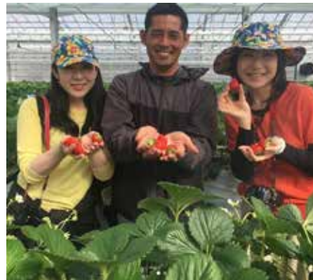
ゴールデンウィークは連日 500 名ほどのお客様が来園。