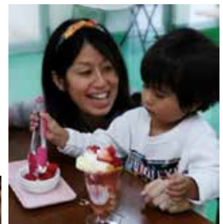
パフェ・ジャム・ケーキ作りなど様々な体験メニューを拡充！