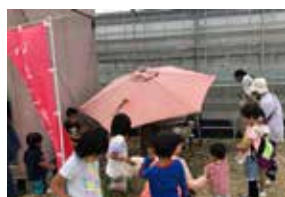
連休中、大人気だったヤギさんへの餌やり。